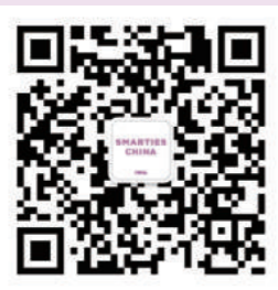
SMARTIES CHINA 微信公众号

SMARTIES CHINA CELEBRATE THE FUTURE 中国无线营销大奖